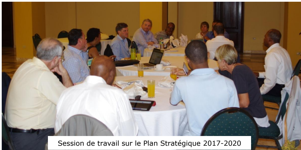
Session de travail sur le Plan Stratégique 2017-2020