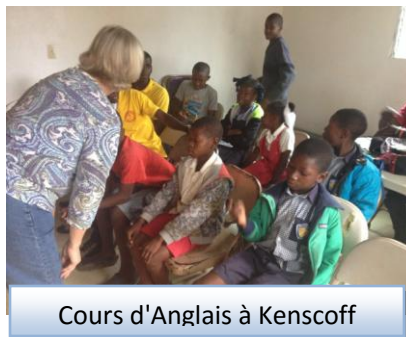
Cours d'Anglais à Kenscoff