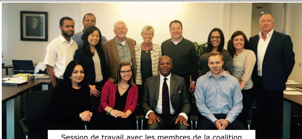
Session de travail avec les membres de la coalition