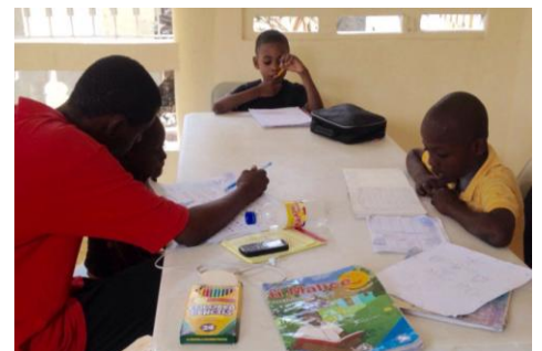
Accompagnement scolaire à Fontamara