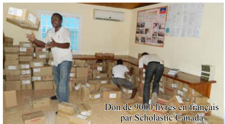
Don de 9000 livres en français par Scholastic Canada

circonstance et ont profité de la visite-surprise du Secrétaire Général pour poser des questions pertinentes relatives aux programmes. Les jeunes de Camp-Perrin ont encore une fois, à mes yeux, brillé de tous leurs feux.