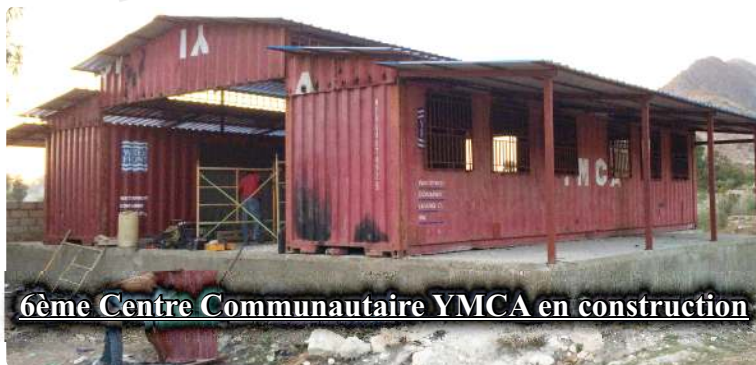
6ème Centre Communautaire YMCA en construction