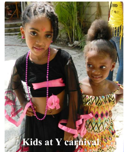
Kids at Y carnival

Port-au-Prince YMCA organized a youth carnival and is busy preparing a conference for women's day on March 8th.