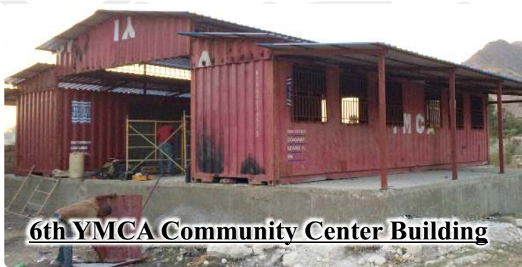
6th YMCA Community Center Building